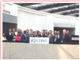
کنفرانس ویژه مشارکت گمرک و بخش تجاری برای مقابله با تروریسم

کنفرانس ویژه مشارکت گمرک و بخش تجاری برای مقابله با تروریسم (CTPAT) از ۲۹ تا ۳۱ آگوست ۲۰۱۷ در ایالات متحده آمریکا برگزار شد.