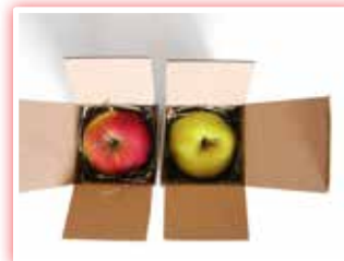
صادرات میوه و تره بار از ۱۵ آبان منوط به رعایت شاخص های بسته بندی است

صادرات فله ای انواع میوه و تره بار به خارج از کشور به خصوص کشورهای حوزه جنوبی خلیج فارس هر از چندگاه باعث بروز مشکلاتی برای صادرکنندگان و وارد آمدن لطمه به اعتبار و موقعیت تجاری کشورمان می شود.