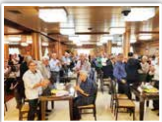
برگزاری مراسم گرامیداشت روز بازنشستگان

مراسم گرامیداشت روز بازنشستگان در گمرک برگزار شد. این مراسم به همت کانون بازنشستگان گمرک ایران و با همکاری شرکت تعاونی مصرف کارکنان گمرک و با حضور پرشور بازنشستگان در محل مجتمع فرهنگی - ورزشی مهرآباد برگزار گردید.